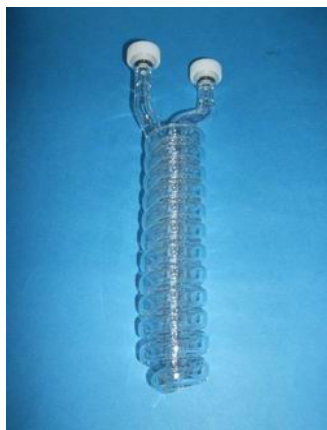
シールジョイント蛇管トラップ(1/4)