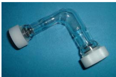
シールジョイント異径L型(1/4-3/8)