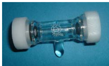
シールジョイントI型(3/8-3/8)