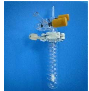
<ニードルバルブ組合せによりトラップに応用>特注品